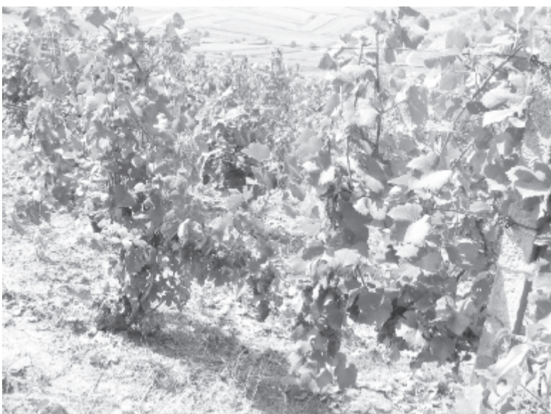
Kordonos szőlőművelés egy vámosgálfalvi szőlőben – archív