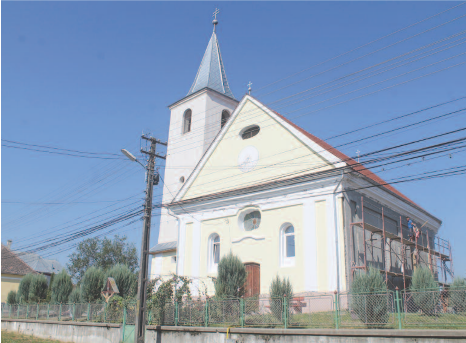
Balavásári Népszó a 6. oldalon